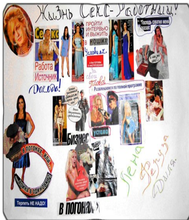
Я и моя жизнь - коллаж членов "Таис Плюс", Кыргызстан