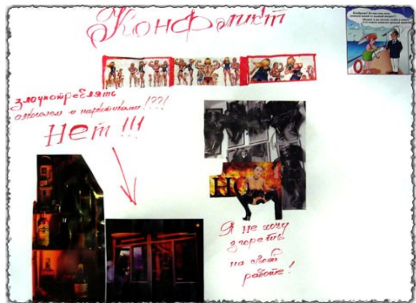
Managing Conflict in my life and work—collage bymembers of Tais Plus, Kyr-

Ответ: Дискриминируют немногие, все относится по-разному.