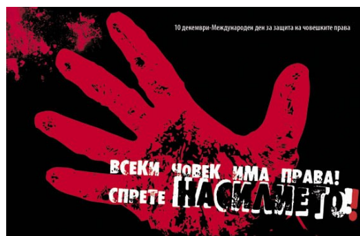
Фонд здоровья и социального развития, Болгария

Избиение, сексуальное насилие, коррупция, полицейский произвол – секс-работники сталкиваются с этой жестокостью и преступлениями гораздо больше, чем остальные люди. Стигматизация секс-работников обществом и органами государственной власти означает, что такое беззаконие и преступность считаются нормой и обычной частью работы и жизни секс-работников.