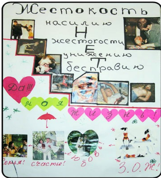
Насилие и моя работа - коллаж, созданный членами "Таис Плюс", Кыргызстан