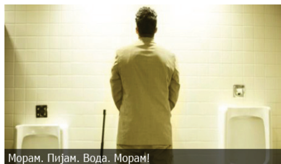
Морам. Пијам. Вода. Морам!

Па, како ќе знаете дали внесувате доволно вода? За да ви го поедноставиме мерењето, ќе ви го претставиме тоа вака... Ако имате доволно течности, во текот на денот ќе уринирате по 2 до 3 пати. Се останато е претерување од кое нема да имате апсолутно никаква корист.